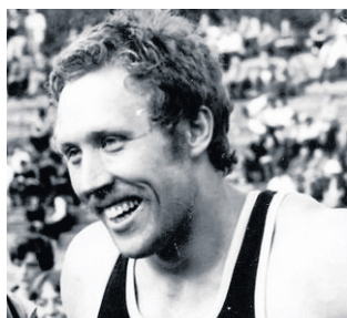
Władysław Kozakiewicz, mistrz olimpijski z Moskwy.

Gdy w 1980 roku kibice gospodarzy igrzysk olimpijskich w Moskwie gwizdali, tylko zagrzewano go do walki. Jak sam wspomina - niosła go wtedy wściekłość, adrenalina. Dziś jest wdzięczny Rosjanom za te gwizdy, bo tylko dołożyli mu nimi kilka centymetrów. Z Moskwy wrócił ze złotym medalem, rekordem świata oraz gestem,